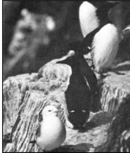
Hekkebestanden av lomvi sank med 80-90 prosent i Finnmark og på Bjørnøya fra 1986 til -87.

Dette er spesielt tydelig for Hjelmsøya i Finnmark, der hekkebestanden av lomvi sank fra 110.000 par i 1964 til ca. 5.000 par i 1988.